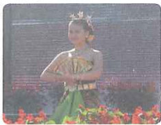
ジャワ民族舞踊のご披露も